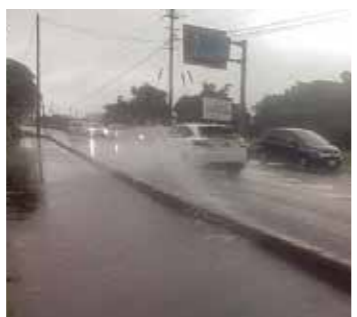
保護者から送られてきた写真

議員 この写真は保護者から送られてきた写真である。車が通る度に水しぶきが上がり危険なため、早急に改善されたい。