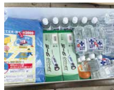
北島町が管理している備蓄品

議員 災害時、本町では職員専用となる備蓄物資の備えがない。職員用の備蓄物資がなければ、長期にわたる支援活動時に支障が出るのでは。