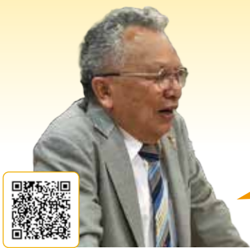
増谷 慎通 議員