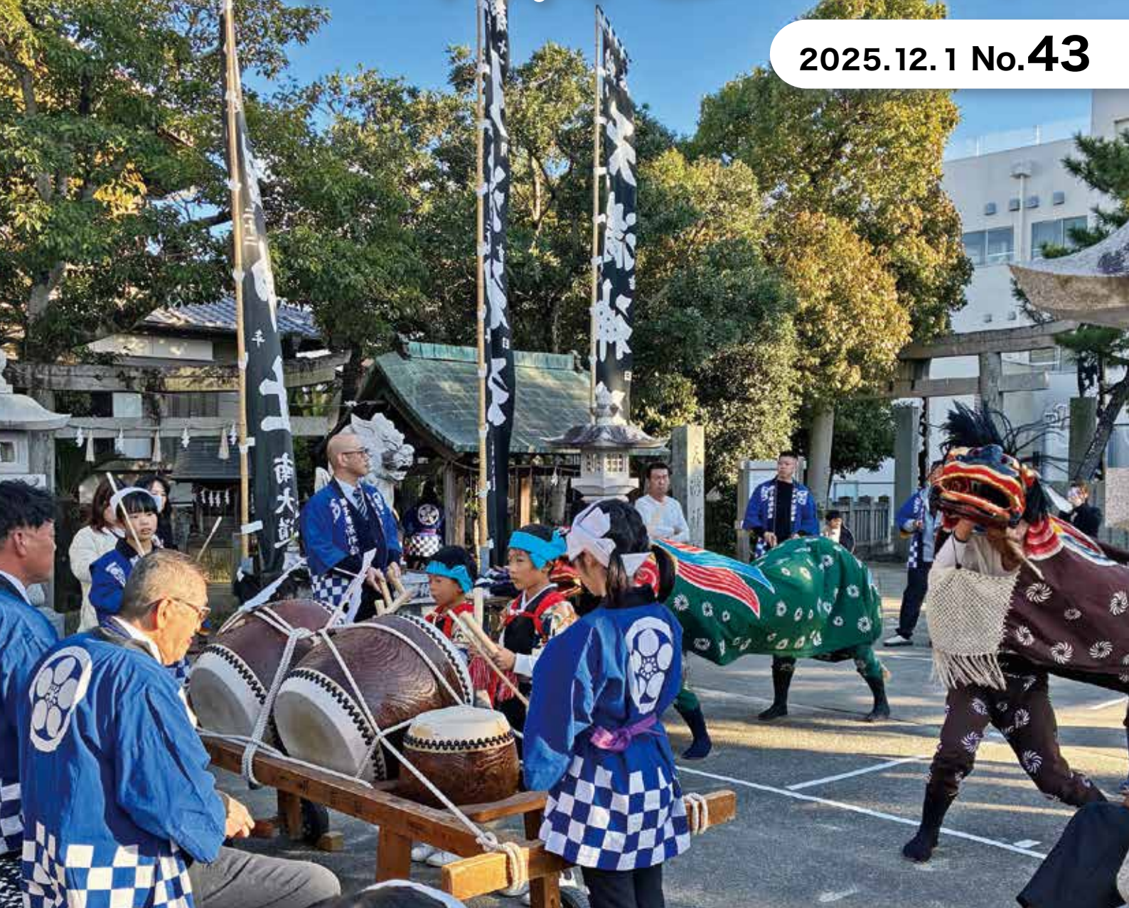
北村天満神社 秋祭り