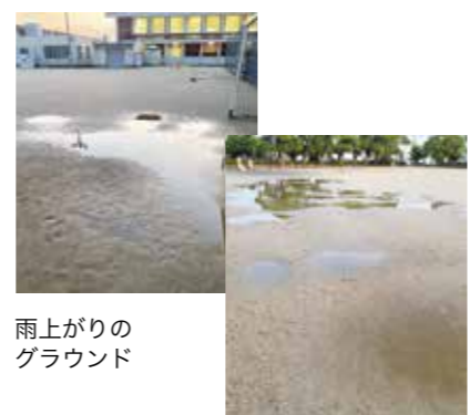
雨上がりのグラウンド

課長 企業から寄附を集めるには訴求力のある事業の提案が必要。制度の活用に向けた魅力的な提案を検証し、企業とマッチングできるように強化を図る。