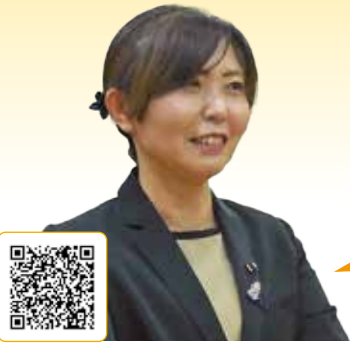
なか の ま ゆ み 中野真由美 議員