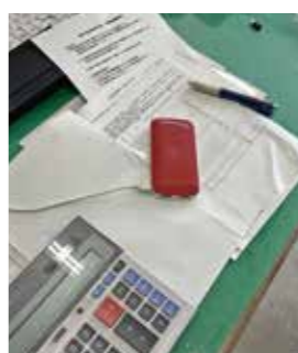
悪い見本を作りました

課長 業務時間中にモバイルバッテリーの充電は行っていない。あらためて取り扱い等における注意点を周知する。