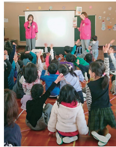
いつも子どもにどのように興味を持ってもらうかという視点を大切にしている。

また活動を継続させていく過程で、メンバー全員の防災に対する意識も変化していった。最初は女性目線に重きを置き、女性が困ることや不安に思うことを解決できる仕組みにこだわっていたが、女性と男性で区別することを前提とせず、立場が弱い方や配慮が必要な方、助けを必要としている方に丁寧に向き合い、寄り添っていききたいと思うようにもなった。熱心に活動を続けていくことで認識も変化し、多様性に富んでいく。