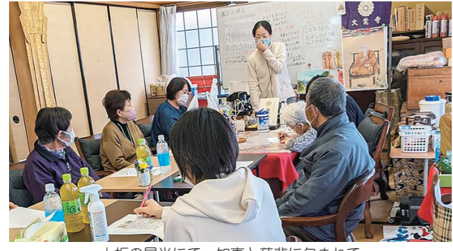
上板の昌光にて 知恵と慈悲に包まれて