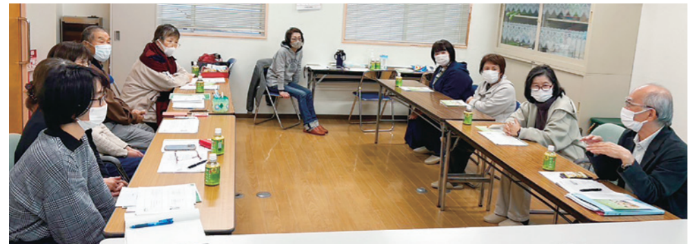
健生石井クリニック ACPについて意見交換