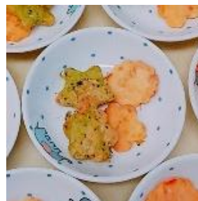
メニュー例：野菜クラッカー (小松菜とトマトを使用)