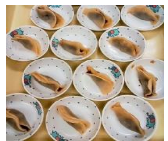
半月餅 (あんこも小豆から手作り)