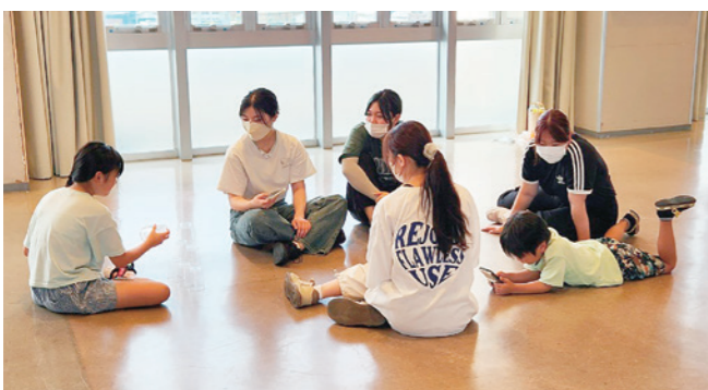
学生ボランティアさんとの交流

学校の休み時間や行事などで声をかけあったり、時には助け合ったりすることができるよう仲間になったという。ある日のこと、どうしても学校の教室に向かうことに気が向かなかった男の子が学校の校門前で、『ひなたぼっこ』で一緒に遊んだ友達を発見して、嬉しそうに駆け寄っていったそう。学校以外の、安心して過ごせる『ひなたぼっこ』の場所で、友達としてつながることの大切さを身に染みて感じた瞬間だったという。子どもが健全に育まれる環境として家庭や学校がある。それに加えて地域の居場所があることで、よりいっそう豊かで安心した子育て環境が築かれ、子どもと親の両方の笑顔が広がっていく。