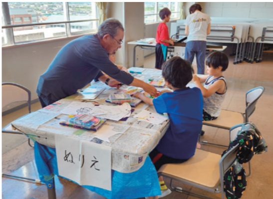
地元のボランティアさんに教えてもらう

『ひなたぼっこ』には、地元のボランティアさんをはじめ、看護学科を専攻する大学生なども参加している。子どもの成長を応援したいという多世代の気持ちが集約され、安心できる温かな親子の居場所になっている。