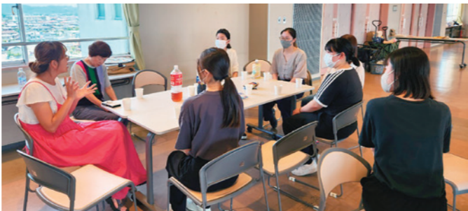
子どもが遊んでいる間の保護者さん同士のお話会

『ひなたぼっこ』は子育てに向かい合っているお父さんやお母さんが、「ここなら安心して子どもを遊ばせられる。」と思えるような居場所を目指してつくられた。保護者がつながって、子育ての悩みを聴きあうことで、ひとりで抱え込んでいた悩みが整理できたり、俯瞰的に捉えられたりして、心に少しゆとりが生まれる。子育て世代が抱える心の葛藤を地域全体で見守っていくカタチがここにある。