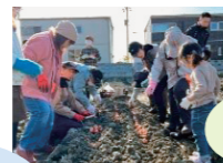
チューリップ 球根植え