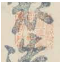
写真3 印 拡大