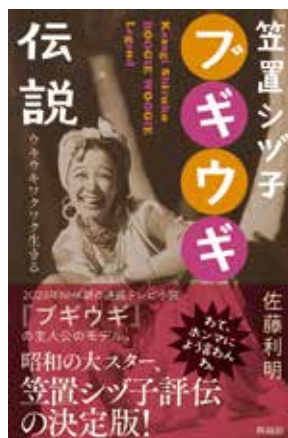
講師著書 興陽館刊