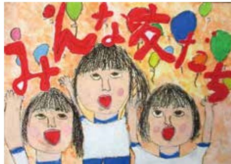
北島南小 2年 長町 優月