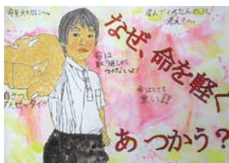
北島南小 5年 明学 晃平