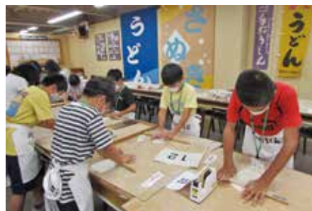
令和5年度「夏の遠足」(うどん打ち体験)

南 地 区…浜、原、中野南、中野北、出口東亜、小西、大西、百石須、江尻西、江尻東