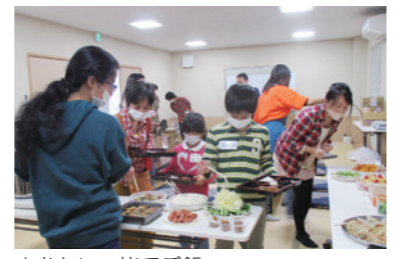
まかない～皆でご飯

運用方法にも工夫がある。参加者らに資源リサイクル品の回収を呼びかけ、それを回収している別のボランティア団体に引き取ってもらう。代わりに、使えそうな物はリサイクルに回る前にManakaに寄付され、ダンボールはフードパントリーの物品を入れる箱となり、自転車や算数セット等はそれらを買えない親子の元へ渡る。その団体も回収品の量が増え、実績となる。