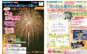
イベントと水上タクシーを組み合わせたツアーを造成し催行