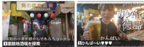
人気Youtuberが徳島の酒場を紹介するショート動画 R5.6時点で20.4万PV