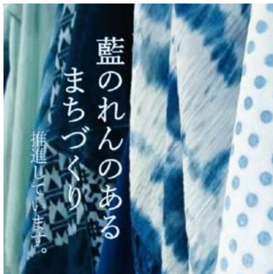
徳島東部圏域の13の工房がのれんを制作

阿波藍染めの振興と徳島らしさを感じられる魅力的なまちづくりを推進するための助成制度 令和4年度は36店舗の飲食店が藍のれんを制作 ※令和3年度から累計で72件