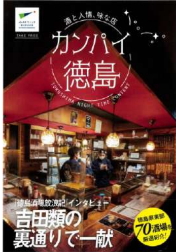
宿泊施設や観光施設で配布する小冊子