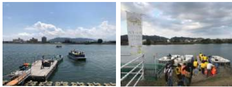
イベントの開催に合わせ、会場に仮設の桟橋を設置 約360名が旧吉野川クルーズを体験

旧吉野川の観光資源化を図るため、イベントの目玉としてひょうたん島水上タクシー（周遊船）を活用