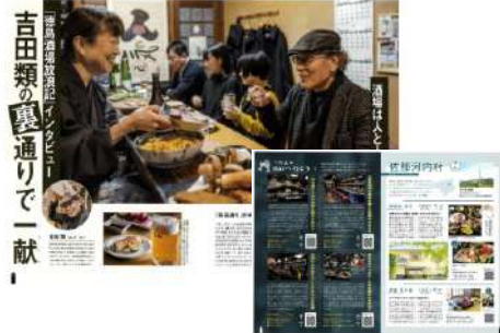
ターゲット層に訴求力のある吉田類氏を起用