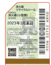
既販品用シール (見本)