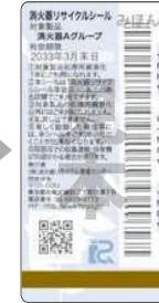
新品用シール (見本)

製品には リサイクルシールが 貼られています。 消火器の使用期限が 過ぎたら、取り扱い 窓口へ引き渡してく ださい。