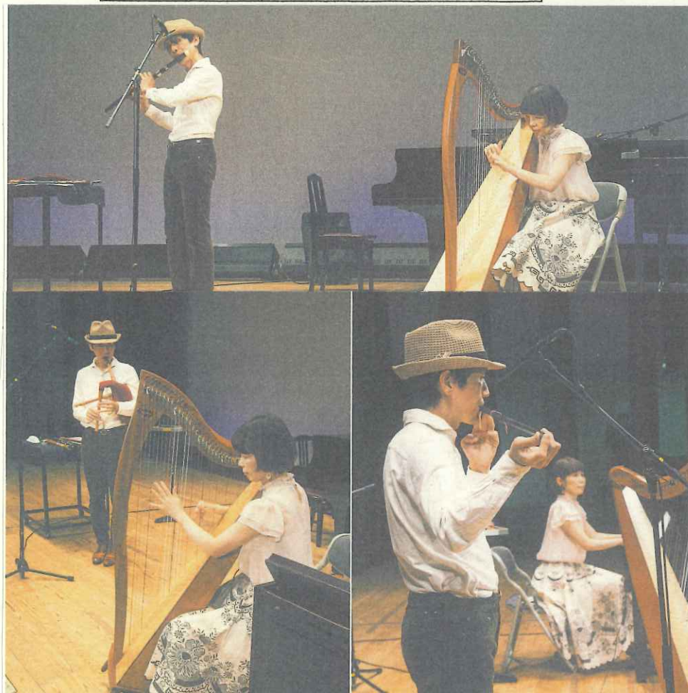
▼下の写真は、リハーサル時に撮影したもの。▼