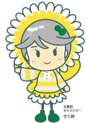
北畠町 キャラクター きく姉