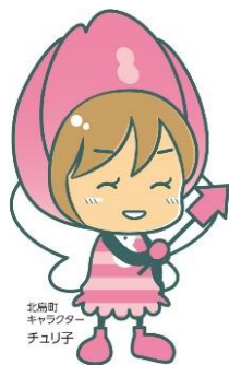
北島町 キャプター チュリ子

家族全体の子育てを応援します。具体的には、不妊治療助成の相談、母子健康手帳の交付や妊娠中の身体のこと、出産後の子育て相談などに対応いたします。また、妊娠届出受理時や各種相談時に、保健師等がお話を聞きながら、必要に応じて、ご家庭にあった子育て応援プランを一緒に作成します。相談者のご希望によっては、関係機関と連携を図っていきます。