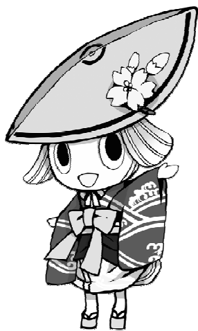
※徳島市イメージアップキャラクター 「トクシ」