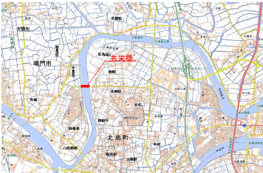
この地図は、国土地理院長の承認を得て、同院発行の電子地形図(タイル)を複製したものである。

4. お問い合わせ： 鳴門市経済建設部土木課 電 話:088-684-1177 北島町建設課 電 話:088-698-9808