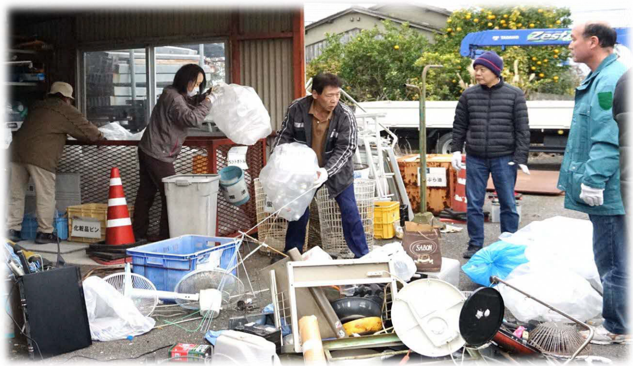
ごみの仕分けはひとつひとつ手作業で行う。