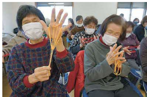
上手にできると満面の笑みがこぼれる