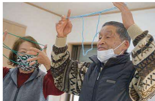
新しく習得したあやとりを見事に披露！！